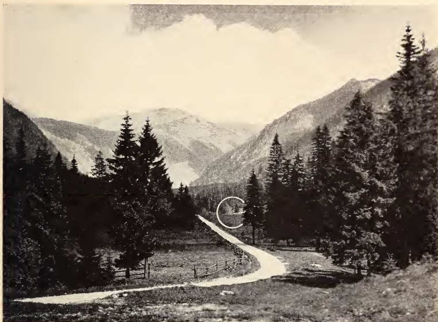
Abb. 3: Sommerstandort von Eptesicus nilssoni und Myotis mystacinus . Der weiße Kreis bezeichnet den Waldrand und die Wiese, wo die Nordischen Fledermäuse noch vor Einbruch der Dämmerung jagten.

in starkem Schneegestöber und war offenbar entkräftet, da diese Witterung bereits mehrere Tage dauerte.